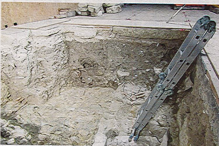
Là où a peut-être été enterré Ludovic Sforza dans la collégiale de Loches.